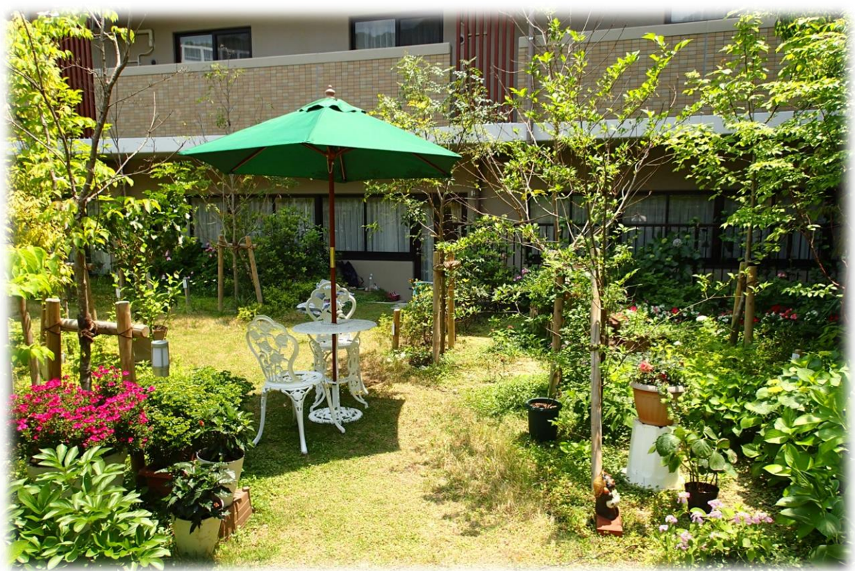
アラベラの家 中庭

2016.6.15 編集：芦屋アラベラの家広報委員会 発行：社会福祉法人緑水会 複合高齢者施設「芦屋アラベラの家」 〒659-0012 芦屋市朝日ヶ丘町9番1号 TEL 0797-23-1200/FAX 0797-23-2200 ホームページ： http://www.arabella.jp/ メールアドレス： ashiya@arabella.jp